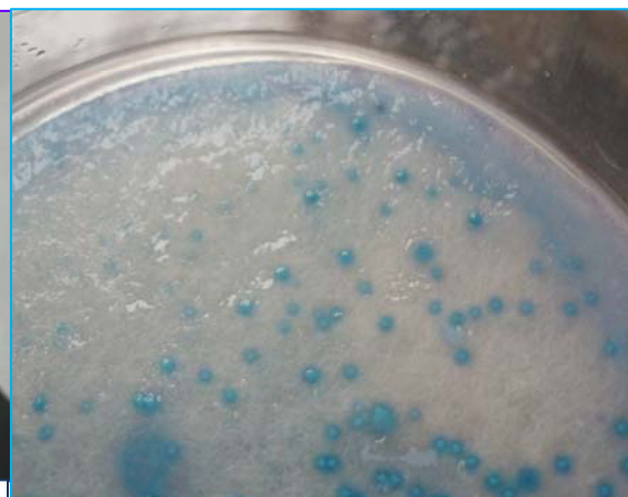
S.epidermidis , S.haemolyticus ... también crecen en DryPlates®-X-STAPH, pero con colonias azul turquesa de aspecto idéntico al de las colonias en el mismo medio agarizado. De este modo, con este medio también se detectan las cepas de estafilococos coagulasa positivos que no son S.aureus .