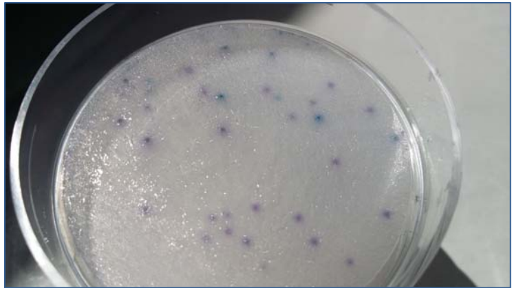
Estafilococos coagulasa positivos: S.aureus crece con colonias de color violeta (mayoría en la foto), mientras S.epidermidis lo hace con colonias de color azul turquesa (6 en la foto).