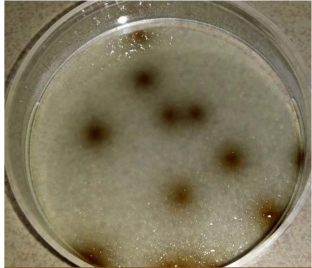
Enterococos fecales, colonias marrones en Dryplates®-ETC