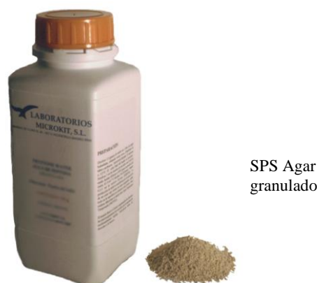
SPS Agar granulado