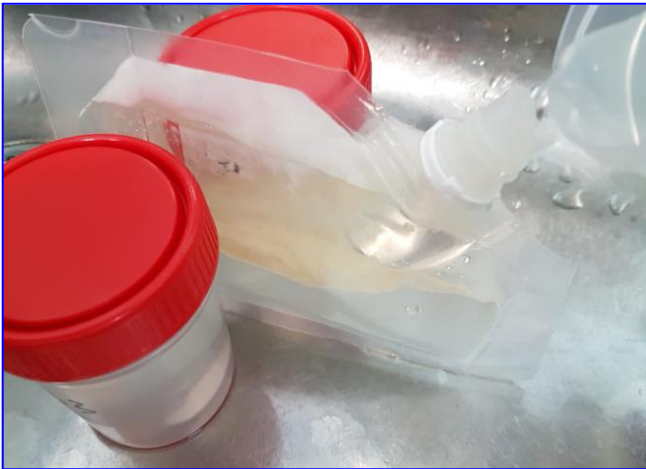
1-Dispensar la muestra dentro de la bolsa, por el tapón

Vea también el video del modo de empleo: https://youtu.be/9ACxFVKJhrM o bien este otro más largo: https://www.youtube.com/watch?v=A8WifR8mZ1k