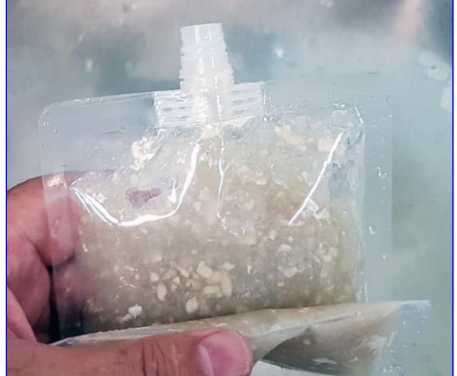
4-Sacando el aire de la bolsa para ahorrarnos el coste de la atmósfera de anaerobiosis