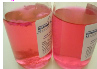
Izda: Mohos en superficie y fondo, Dcha: Levaduras enturbiando