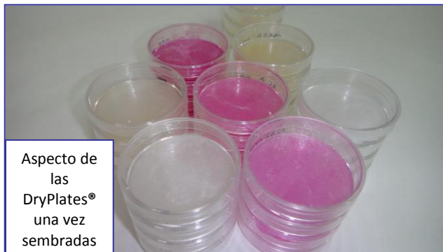
Aspecto de las DryPlates® una vez sembradas

Las DryPlates® son placas preparadas, estériles y listas para su uso inmediato, con 2 años de caducidad desde fabricación, al estar elaboradas con medio deshidratado, que se hidrata precisamente mediante la muestra en el momento de inocularla. La gelificación en frío (a diferencia del clásico medio con Agar-agar, que precisa hervir para gelificar) se consigue con un desarrollo de MICROKIT denominado "Hidragar", que ahorra el hervido-fusión-enfriado-a-45°C y las 2 horas de todo este trabajo propio del medio clásico. El reparto inmediato de la muestra y la distribución homogénea del medio se consiguen gracias al Disco Nutriente , un disco fibroso de malla muy fina que retiene juntos el medio de cultivo en polvo y la muestra.