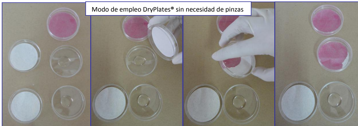
Modo de empleo DryPlates® sin necesidad de pinzas

Si se prefiere, puede tomar el disco nutriente con unas pinzas y colocarlo directamente sobre el ml de muestra, previamente dispensado en el centro de la placa):