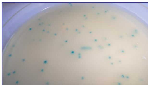
S.epidermidis , colonias azul turquesa